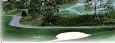
ホテル...エバリスカントリークラブ...済州空港

2006年オープンのゴルフ場。セビョルコース、スキキの林や松の樹林が配置されたパインコース、湖コースの3つがあり、各コース共に火山岩・自生植物、湖が配置されています。