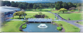
ホテル...オラカントリークラブ...済州空港

済州島を代表する国際水準の名門ゴルフ場。済州島十景のひとつ、ヨングチュナ渓谷に沿って造成され3コースがあります。